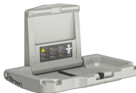
Table à langer murale