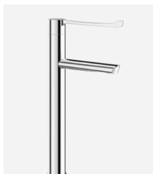
Bec fixe H.300 L.160 Réf. DELABIE : 2665T3