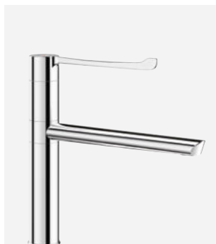
Bec orientable H.160 L.250 Réf. DELABIE : 2664T2

Illustrations disponibles sur notre site internet delabie.fr , rubrique Presse