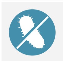
Hygiène maximale : contrôle du biofilm