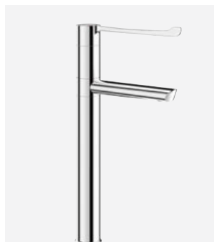
Bec orientable H.300 L.160 Réf. DELABIE : 2664T3