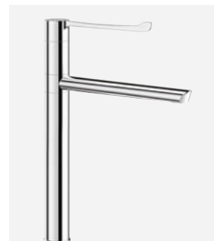
Bec orientable H.300 L.250 Réf. DELABIE : 2664T4