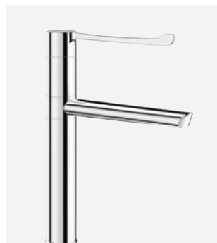
Bec orientable H.200 L.200 Réf. DELABIE : 2664T5