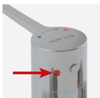
Choc thermique aisé sans démontage de la manette