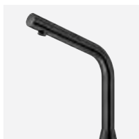
Finition noir mat H. 250 mm