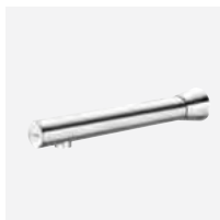
Version murale chromée L. 220 mm