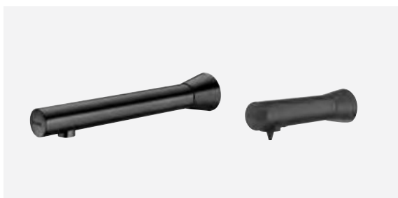
Robinet de lavabo automatique noir mural BLACK BINOPTIC 2 et distributeur de savon noir mural BINOPTIC Réfs. DELABIE : 384130, 512051BK